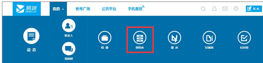
图 1：资料库跳转入口

在资料库页面，可以对文档、图片、音乐、视频进行上传、编辑和共享。教师通过资料库上传教材，学生可以通过资料库完成老师布置的作业。