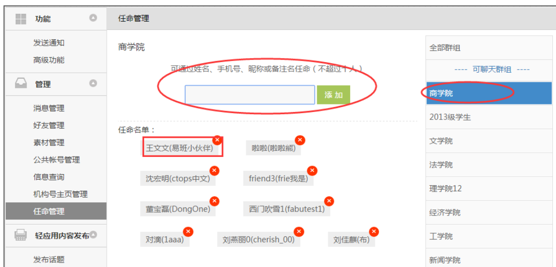
图 1：管理员任命与取消任命