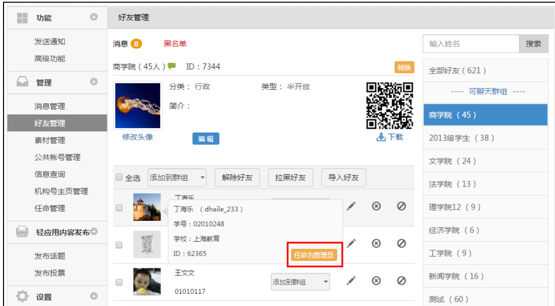
图 2：【好友管理】界面中管理员的任命

方式二：管理员进入【好友管理】界面，通过点击好友图片右下角的【任命为管理员】或【取消任命管理员】来完成任命